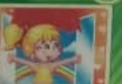
Защипай и ты укрепляй здоровье.