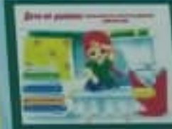
Дети имеют право на информацию.