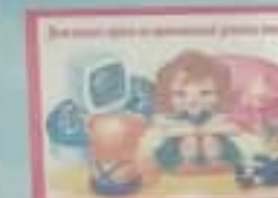
Дети имеют право на свободу мысли.