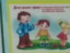
Дети имеют право на свободу выражения мнений.