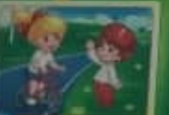
Питайся фруктами и овощами.