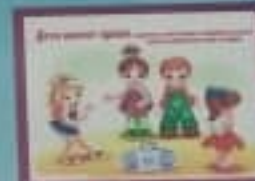
Дети имеют право на безопасную среду.