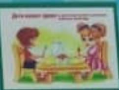
Дети имеют право на образование.