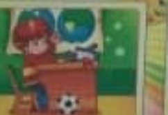
Не сутупись! Прямая осанка - залог здоровья.