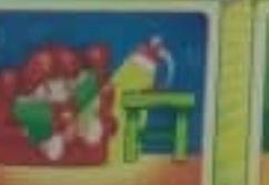
Пей и чисти зубы при употреблении сладостей.