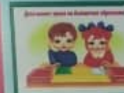
Дети имеют право на свободу совести.