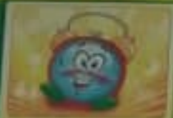
Соблюдая режим дня.