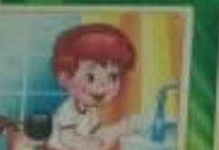
Мой руки перед едой, после прогулки и игр с игрушками ежедневно.