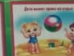
Дети имеют право на спорт.