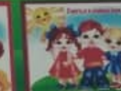
Дети имеют право на защиту от насилия.