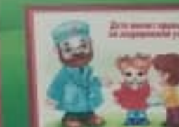
Дети имеют право на охрану здоровья.