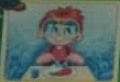
Почувствуй вкус яблока.