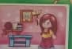
Соблюдай тишину в библиотеке, библиотеке, читальном зале.