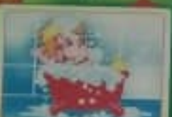
Щедро мой руки мылом ежедневно.