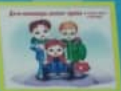
Дети имеют право на отдых и игры.