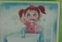
Почисти и зубы и язык утром и вечером.