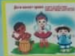
Дети имеют право на участие в культурной жизни.