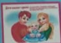
Дети имеют право на семью.