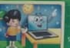
Занимайся на компьютере не более 30 минут в день.