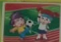
Веди активный образ жизни.